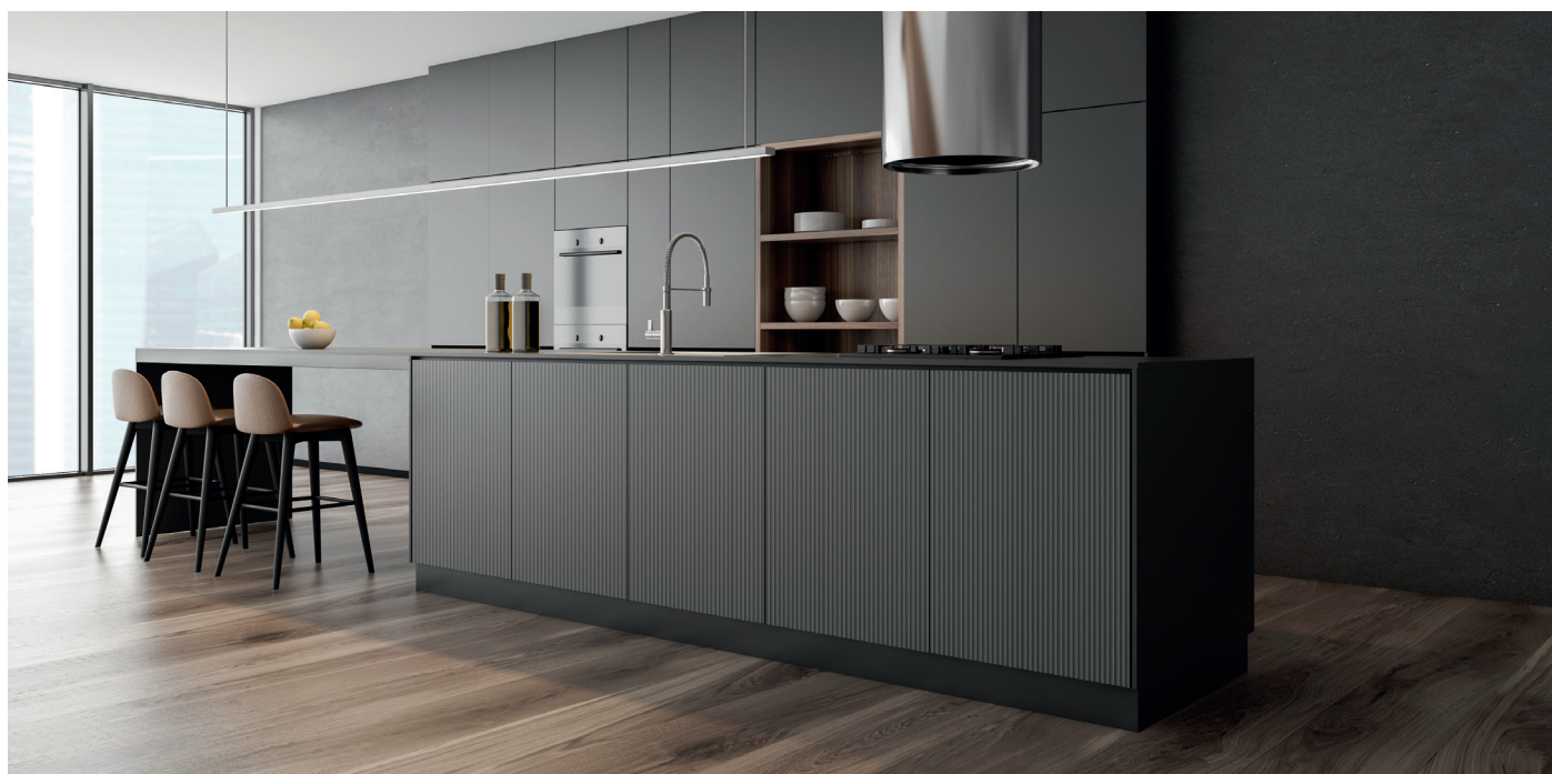
Möbelfronten Oro Nero – Façades de meubles en Oro Nero